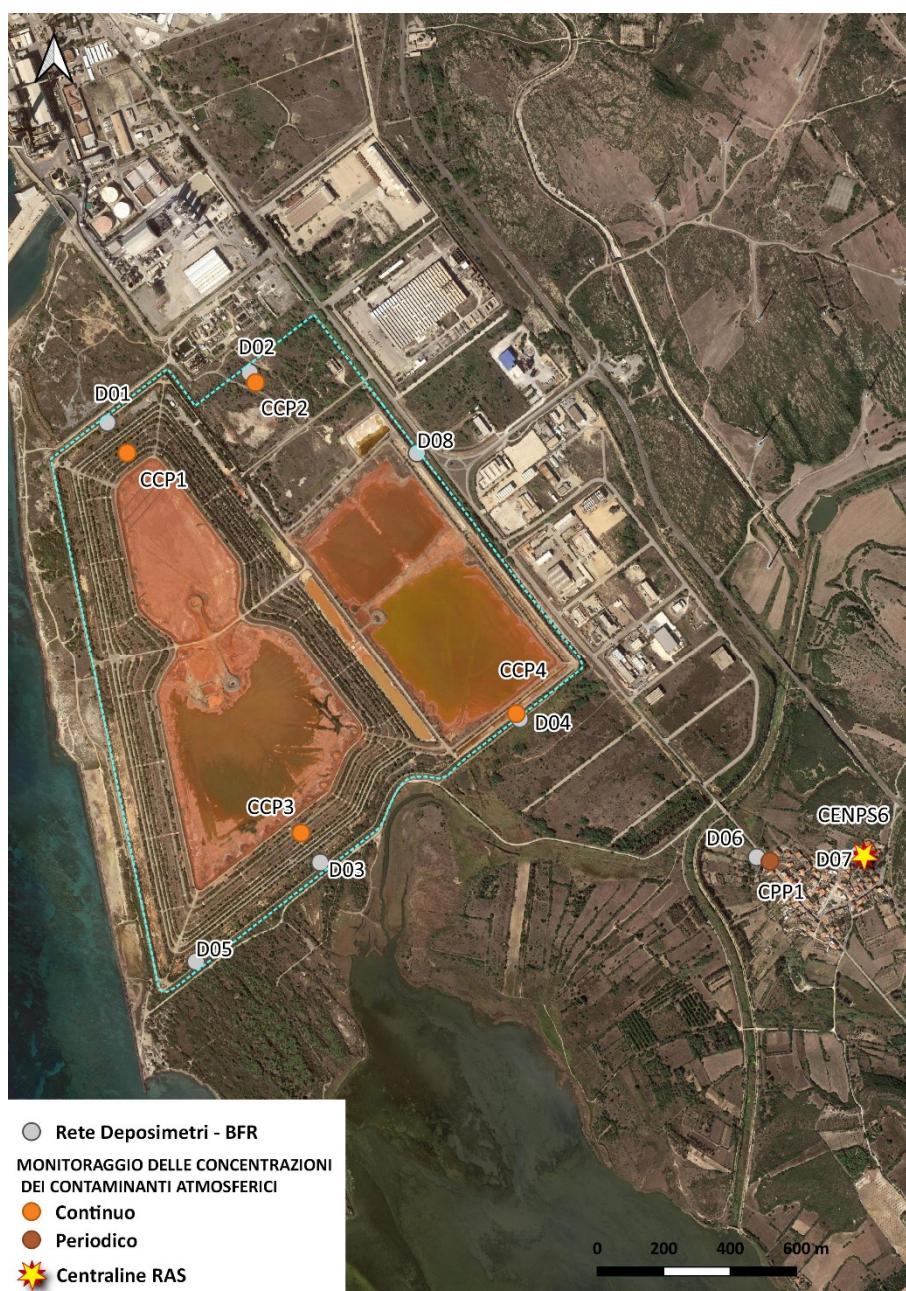
Figura 10. Rete di monitoraggio polveri – sito BFR