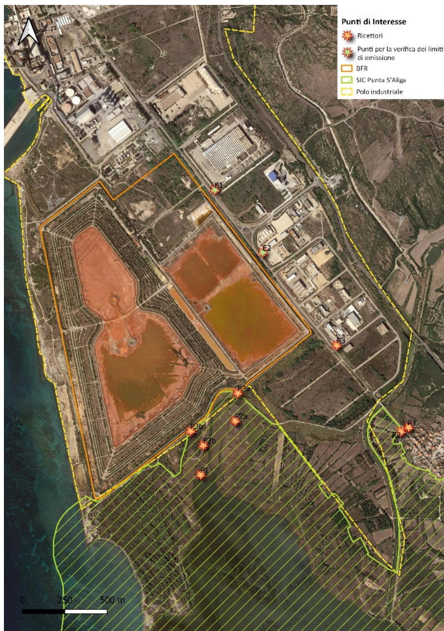
Figura 6. Ricettori di riferimento sito BFR

Durante la campagna per la determinazione del clima acustico ante operam sono stati individuati quali Ricettori sensibili quelli indicati in Figura 6.