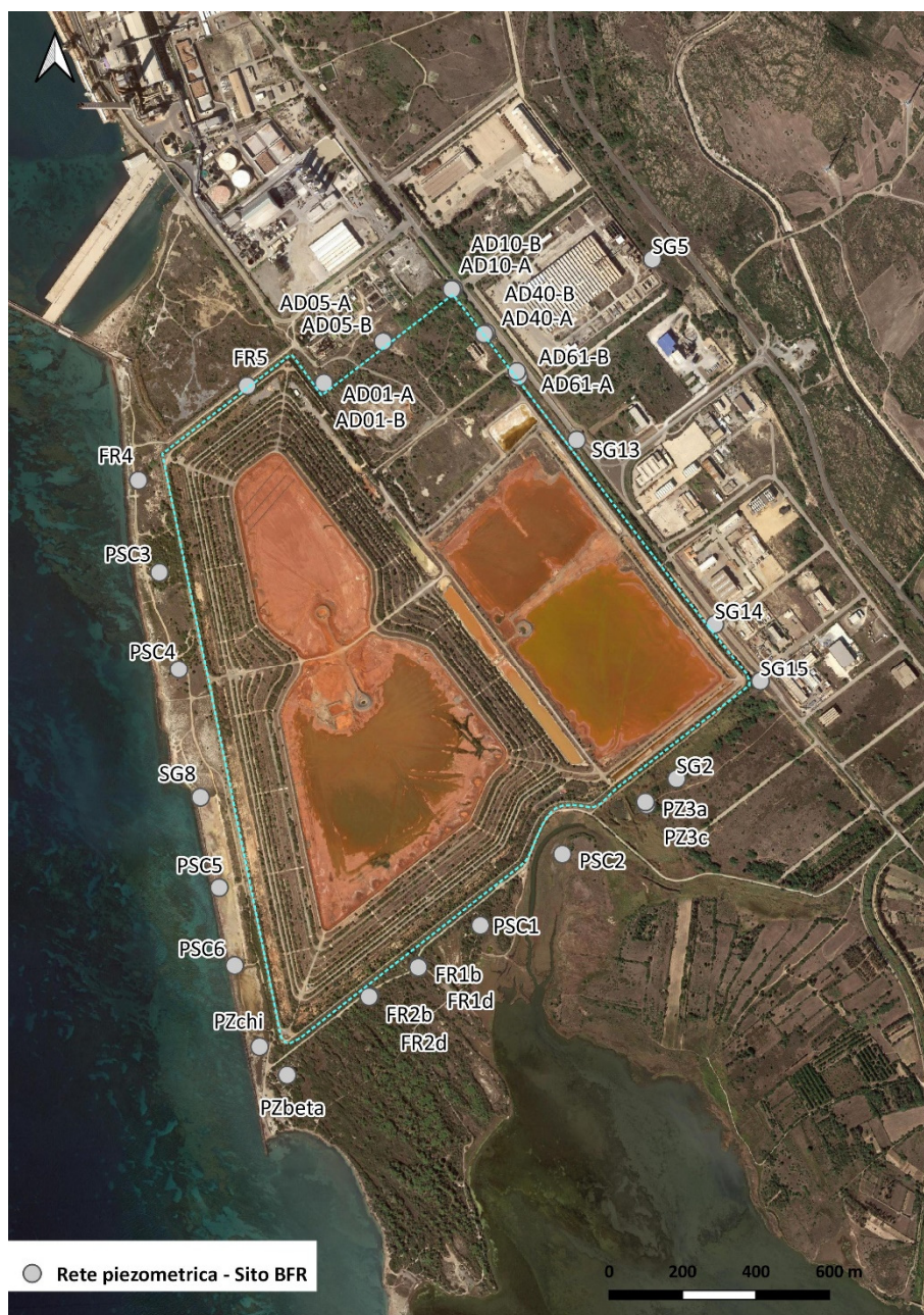
Figura 8. Rete piezometrica per il monitoraggio della falda – sito BFR.