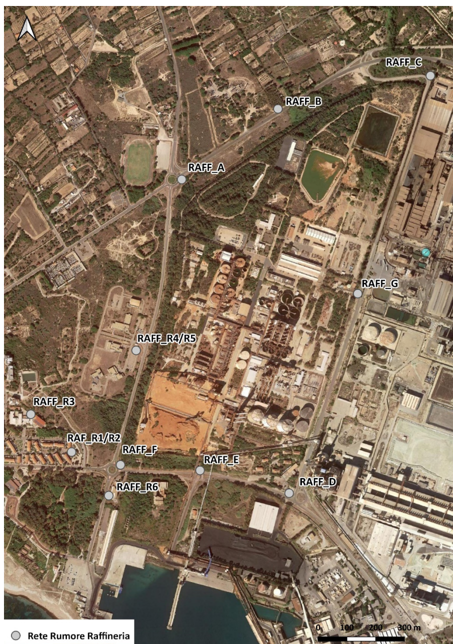
Figura 3. Postazioni di misura campagne fonometriche – sito stabilimento