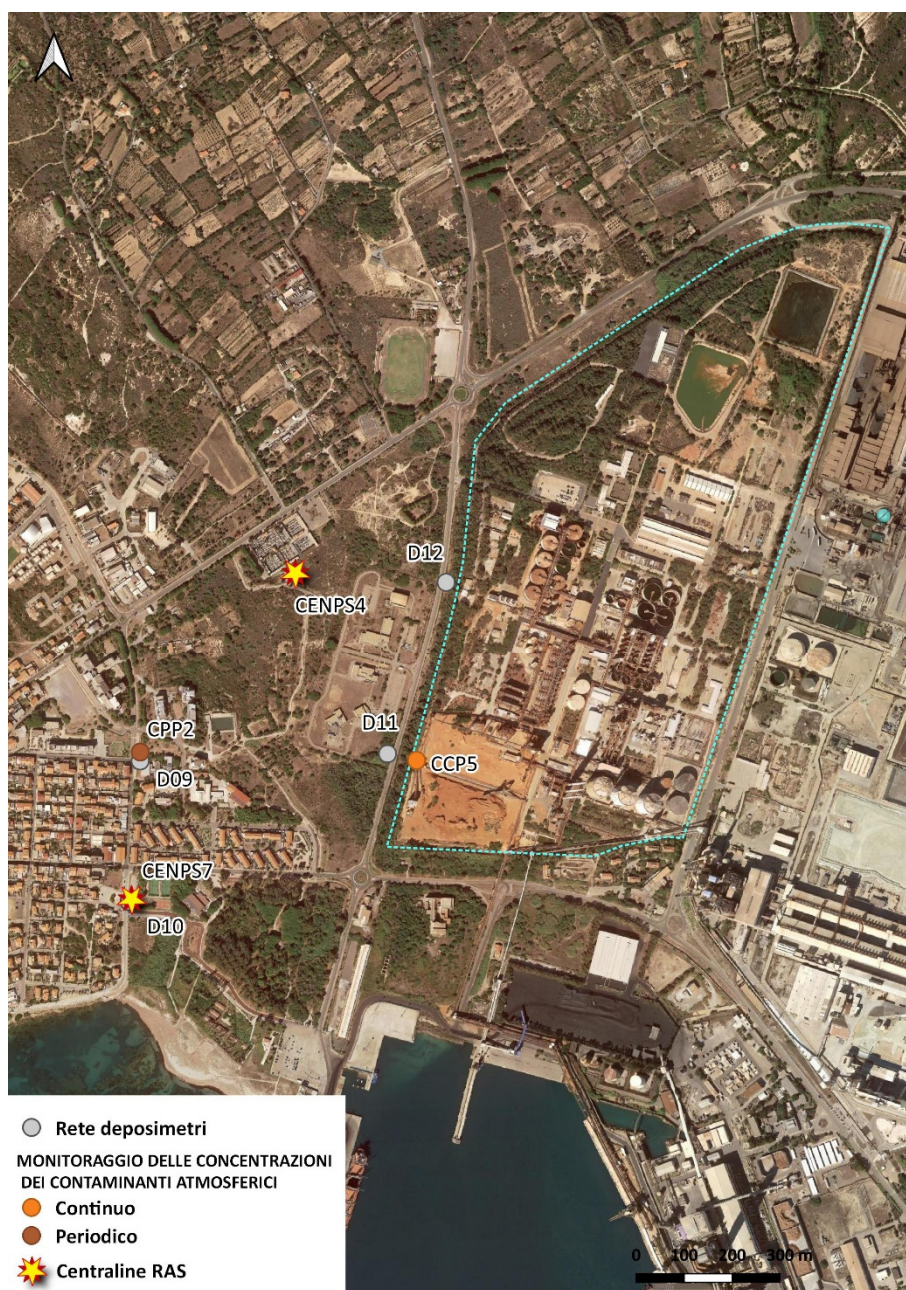
Figura 5. Rete di monitoraggio polveri – sito stabilimenti