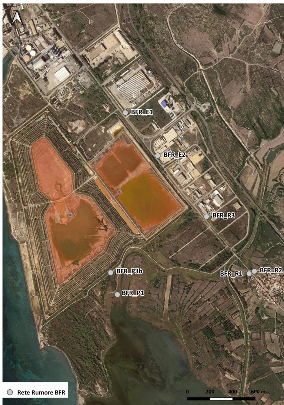
Figura 7. Postazioni di misura campagne fonometriche – sito BFR