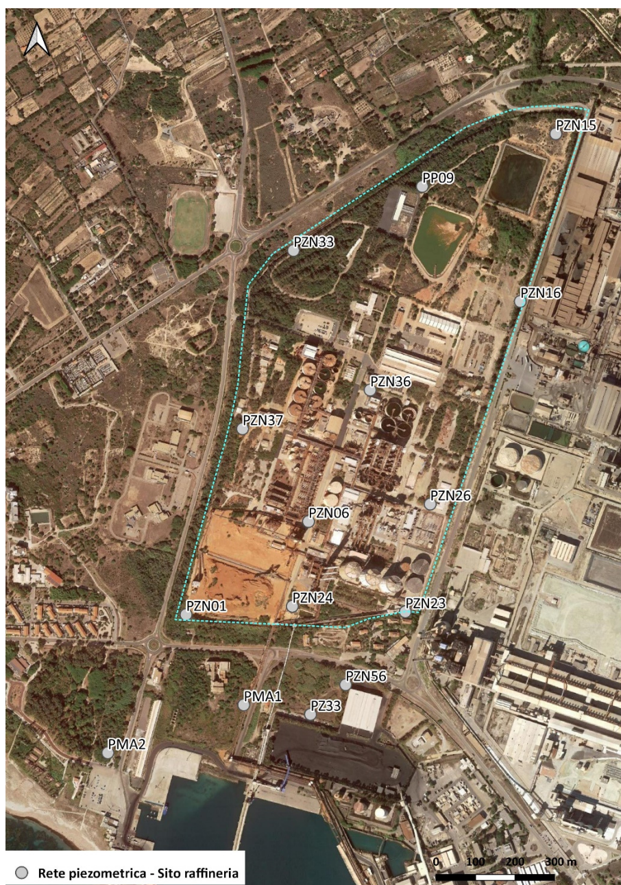
Figura 4. Rete piezometrica per il monitoraggio della falda – sito stabilimento