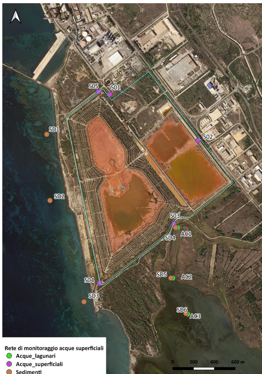
Figura 9. Localizzazione punti di monitoraggio acque superficiali

(**) I parametri da analizzare sono quelli riportati nelle principali normative di riferimento per la tutela dell'ecosistema marino (D.M. 24.01.1996; D.M. 260/2010; D. Lgs. 219/2010), la maggior parte inclusi nell'elenco di priorità di sostanze chimiche di cui al Reg. 2455/2001/EU.